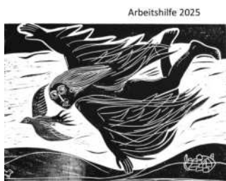
Luft, die uns atmen lässt